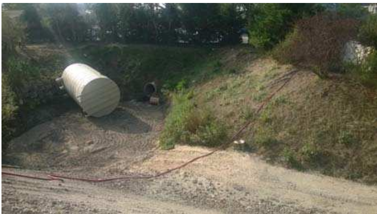
Livraison de la cuve pour le nouveau poste de refoulement