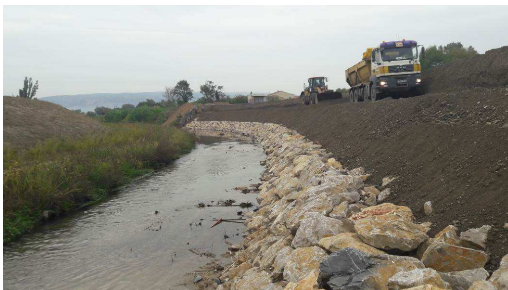
Fin de la protection en enrochements pour la protection en pied de digue au droit du bassin pluvial des Ratacans, côté cours d'eau