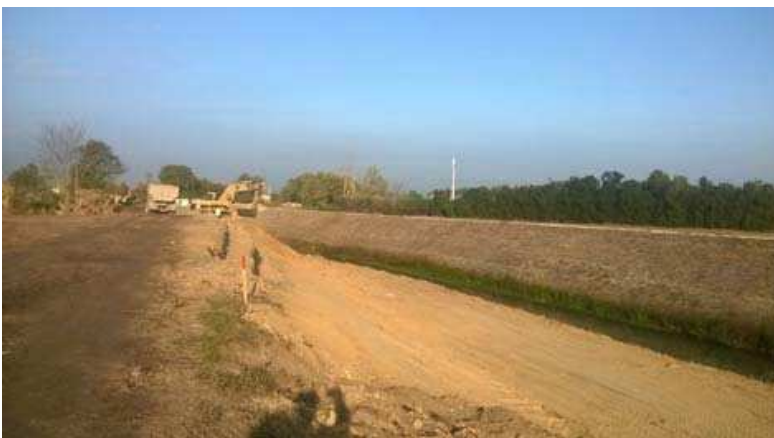
Retalutage des talus de la digue et déblai sur sa partie supérieure