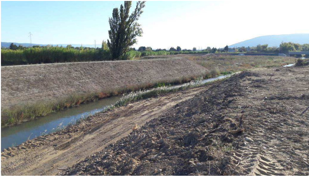
Début des déblais en pied de digue, réalisation de la piste pour la mise en œuvre des enrochements en pied de talus sur la partie amont du chantier entre le remblai SNCF et le bassin des Ratacans