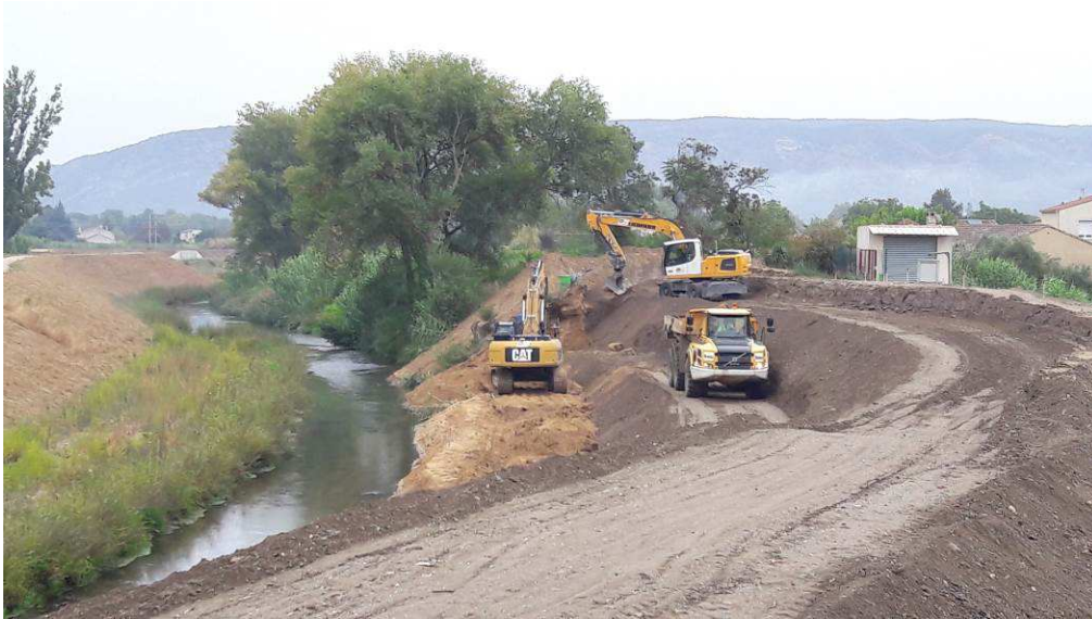
Début des remblais en argile au droit du bassin pluvial des Ratacans, côté cours d'eau