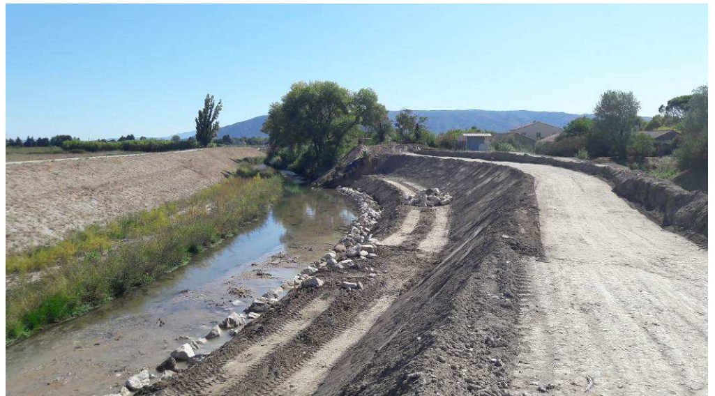
Début de la protection en enrochements pour la protection en pied de digue au droit du bassin pluvial des Ratacans, côté cours d'eau