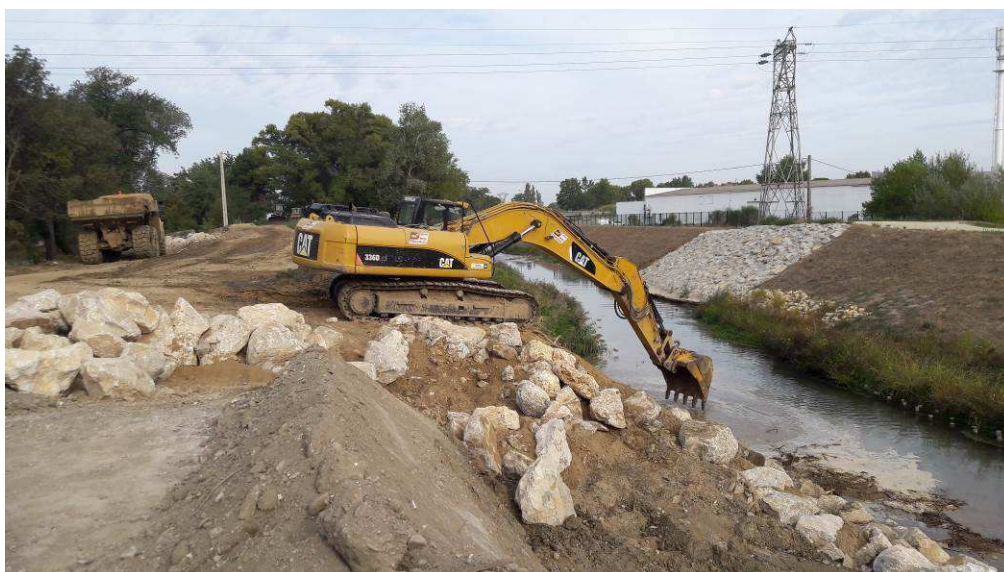
Ancrage des enrochements au droit de l'exutoire du canal de Vidauque.