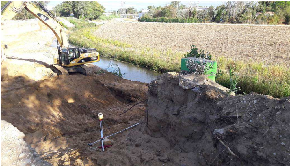
Fin des déblais au droit du bassin pluvial des Ratacans.