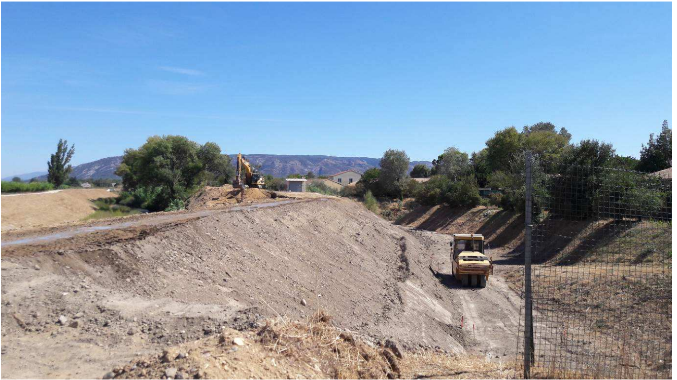
Fin des remblais au droit du bassin pluvial des Ratacans.