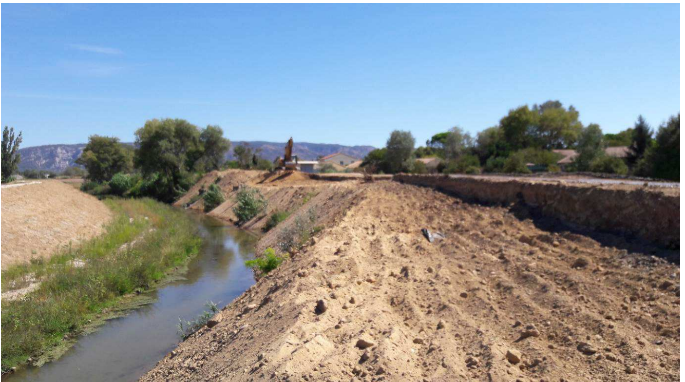
Début des déblais coté cours d'eau au droit du bassin pluvial des Ratacans.