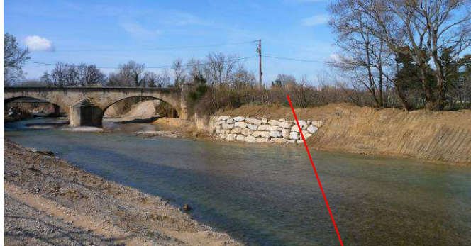
Protection de berge en enrochement amont du pont en rive droite