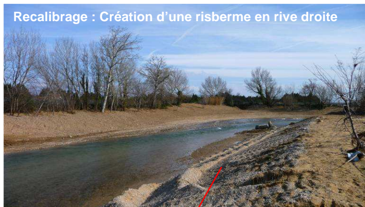
Recalibrage : Création d'une risberme en rive droite