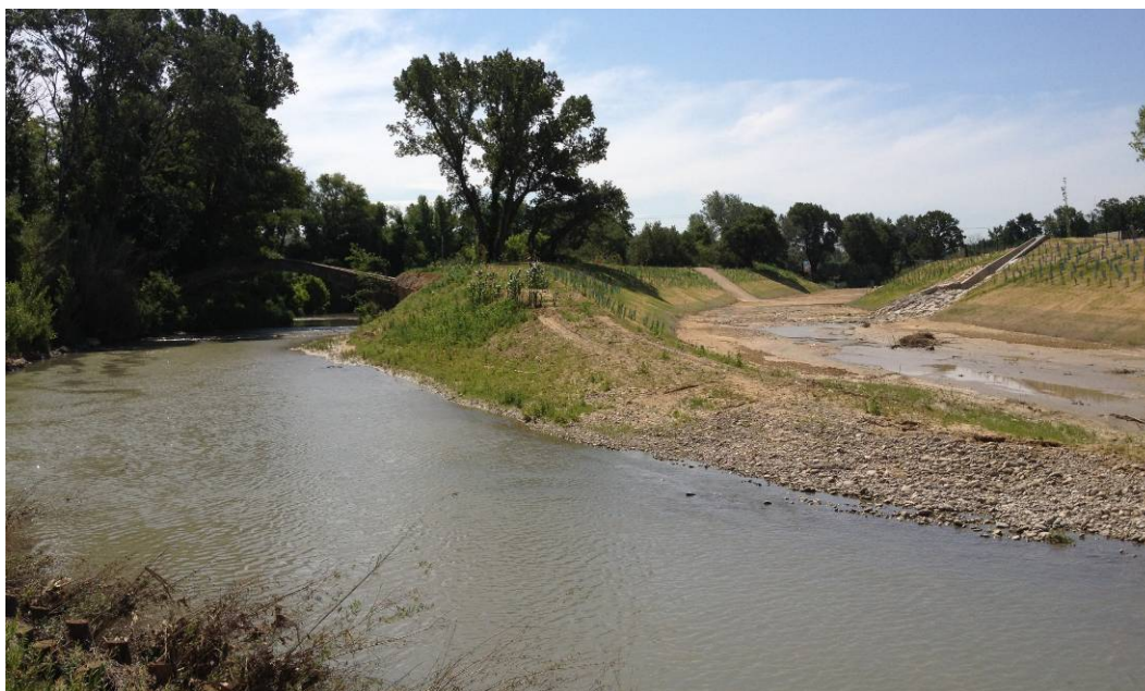
Le Coulon-Calavon aménagé sur la commune de Cavaillon 2012

Les mesures émanant du SAGE peuvent concerner la coordination entre acteurs, des règles adaptées au contexte local et des actions à proprement parler. La plupart de ces actions sont destinées à être contractualisées notamment avec des partenaires financiers, tels que l'Etat, l'Agence de l'eau, la Région ou le Département. C'est le futur contrat de rivière Calavon-Coulon, porté par le SIRCC (Syndicat Intercommunal de Rivière du Calavon-Coulon), qui devrait « accueillir » la majorité de ces actions (le premier contrat de rivière signé en 2002 était porté par le Parc). Quant au PAPI, également pris en charge par le SIRCC, il comportera les actions relatives aux inondations.