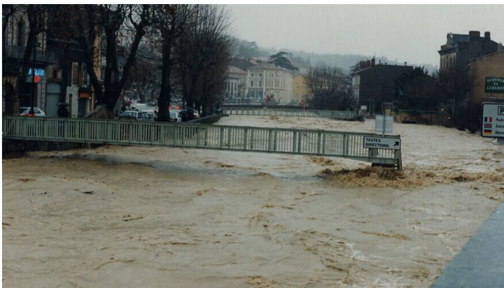
Crue du Coulon-Calavon à Apt en janvier 1994

Le Calavon ou Coulon est un cours d'eau méditerranéen habitué à de fortes variations et notamment des crues menaçant les hommes et leurs activités. Dans le Pays, chacun se souvient des inondations sur Cavaillon et Apt en 1994 et 2008. D'ores et déjà, la commune de Cavaillon, puis le Syndicat Intercommunal de Rivière du Calavon-Coulon (SIRCC) à partir de 2007, ont mis en œuvre un Programme d'aménagement du Coulon à Cavaillon. Il s'agit aujourd'hui de poursuivre en amont de Cavaillon les travaux d'aménagement autorisés par l'Etat. Le PAPI doit cependant permettre d'assurer la cohérence de l'ensemble des mesures relatives aux inondations à l'échelle du bassin versant.