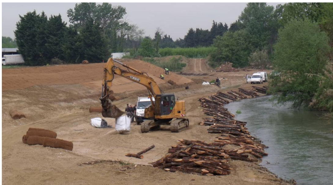
Travaux de protection sur la commune de Cavillon 2011