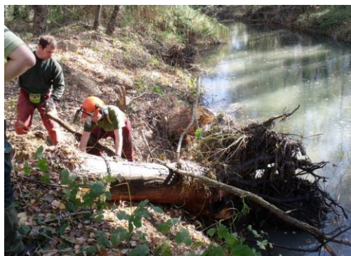
Travaux d'Entretien aux Fayardes à Cavaillon

Sept phases de travaux d'entretien et de restauration ont été réalisées depuis l'hiver 2007/2008. De septembre 2015 à avril 2016, 50 km de berges de cours d'eau auront ainsi été entretenus par le Syndicat de Rivière. Un nouveau plan pluriannuel est en préparation, avec la sortie prochaine d'un guide pratique à l'attention des riverains ■